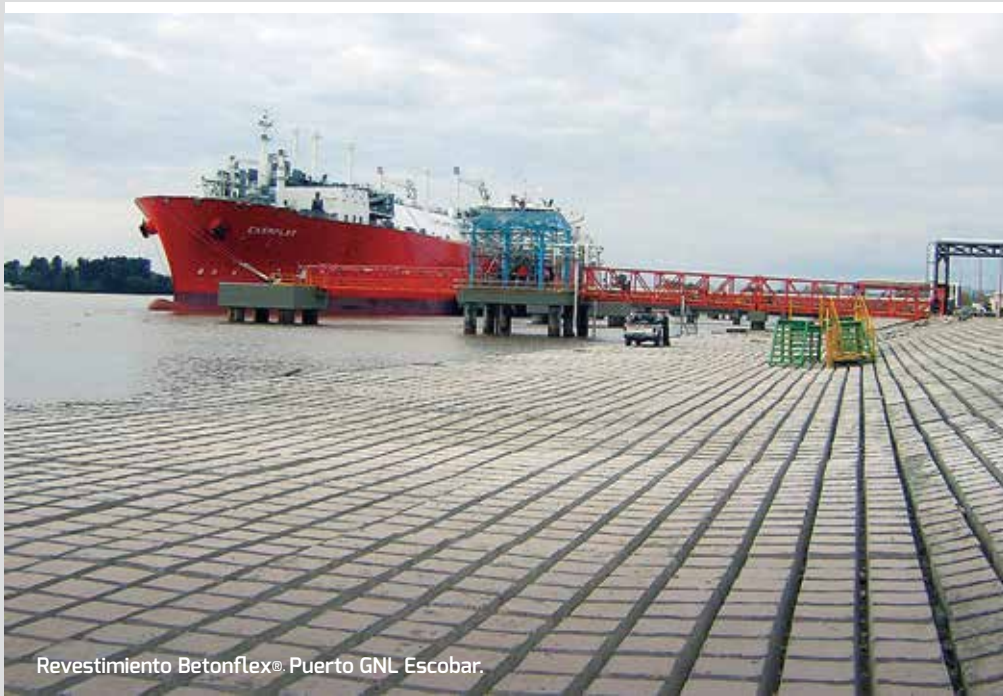
Revestimiento Betonflex® Puerto GNL Escobar.