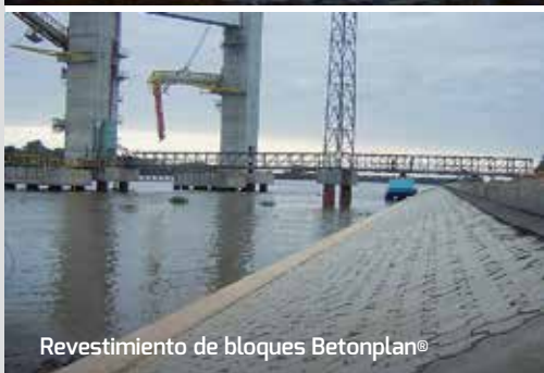
Revestimiento de bloques Betonplan®