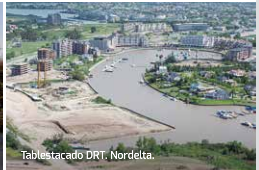
Tablestacado DRT. Nordelta.