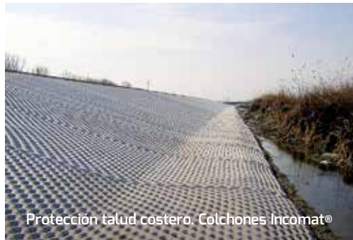
Protección talud costero. Colchones Incomat®