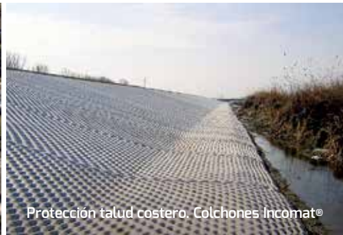
Protección talud costero. Colchones Incomat®