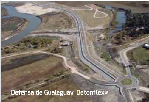
Defensa de Gualeguay. Betonflex®