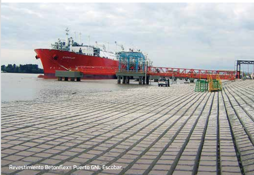
Revestimiento Betonflex® Puerto GNL Escobar.