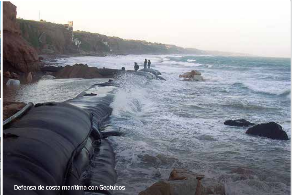
Defensa de costa marítima con Geotubos