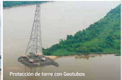
Protección de torre con Geotubos