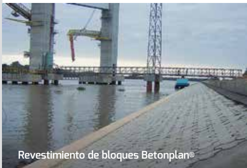
Revestimiento de bloques Betonplan®