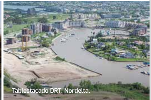
Tablestacado DRT. Nordelta.